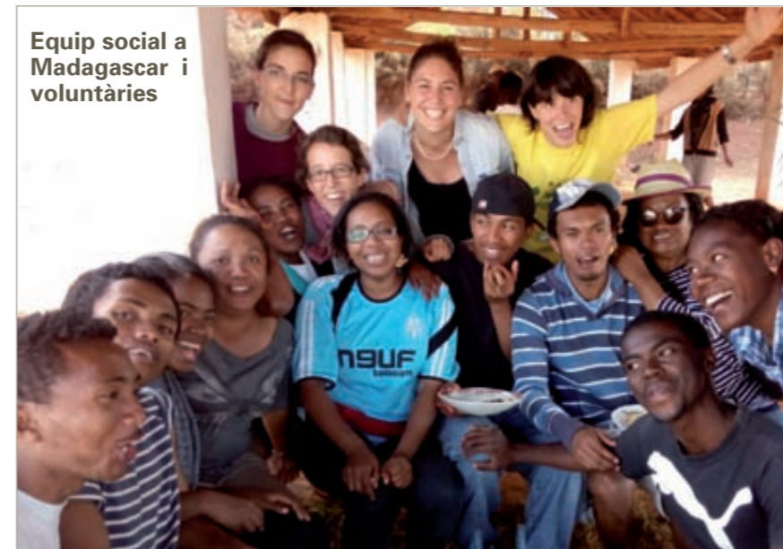
Equip social a Madagascar i voluntàries

a Vontovorona. Al CEM es serveixen 850 àpats al dia. Hi ha 70 nens i nenes a la llar d'infants i parvulari i, 250 alumnes de primària i secundària que hi completen la mitja jornada a l'escola pública. Els pares i mares de tots aquests nens participen un dissabte al mes en una jornada de bricolatge i manteniment de les instal·lacions, fent de l'escola un projecte participatiu entre mestres, alumnes i famílies. També fan torns a la cuina per ajudar a la cuinera amb el menjar. Agraïm especialment la col·laboració de l'Ajuntament de El Prat de Llobregat.