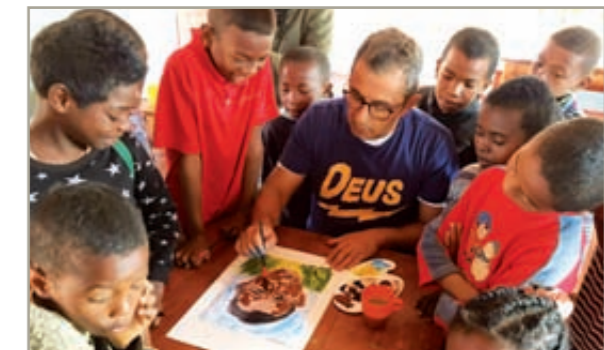
Andreu Buenafuente en el taller RETRATS que va fer amb els nens i les nenes del Centre Educatiu Mandrosoa

Entre juliol i agost hem comptat amb la visita de viatgers solidaris que han aprofitat la seva estança a la Maison TSINJO per fer tallers amb els nens i nenes durant el casal d'estiu. Els viatgers solidaris que passen uns dies a la Maison TSINJO , tenen la possibilitat de triar entre fer alguna sortida cultural o un taller amb els nens i nenes del Centre Educatiu. Hem tingut visites de famílies amb fills adolescents que han gaudit de l'experiència. Des de YAMUNA procurem que la Maison TSINJO sigui una segona llar tant per als locals com per als estrangers que s'hi apropen a passar uns dies.