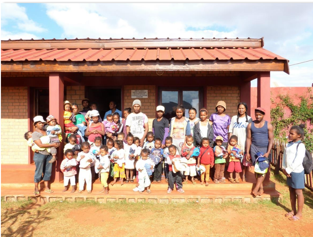
Niños y niñas del jardín de infancia con sus familias