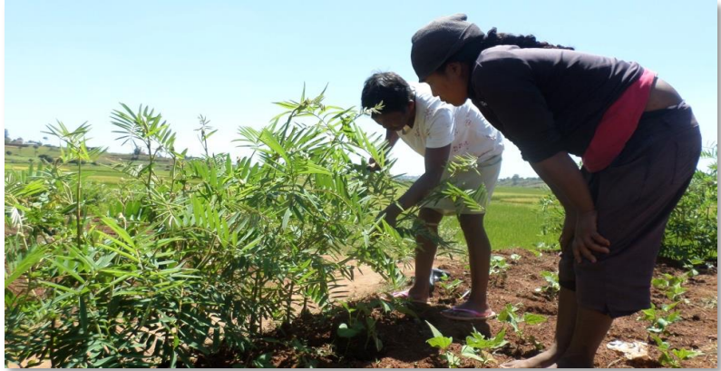
Formadora experta en agroecología y mujer usuaria del proyecto