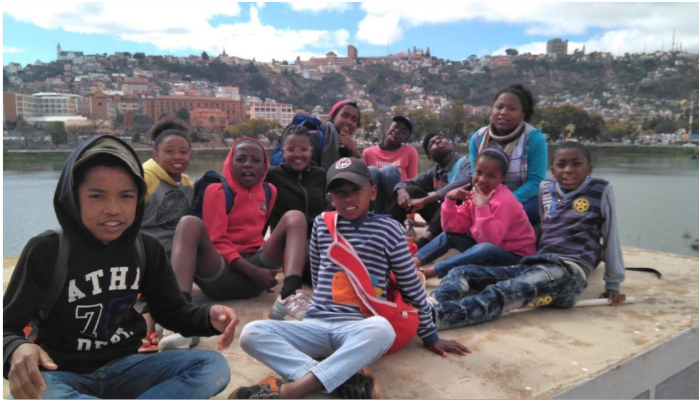
Algunos niños y niñas de las casas de acogida en su excursión a Tana.