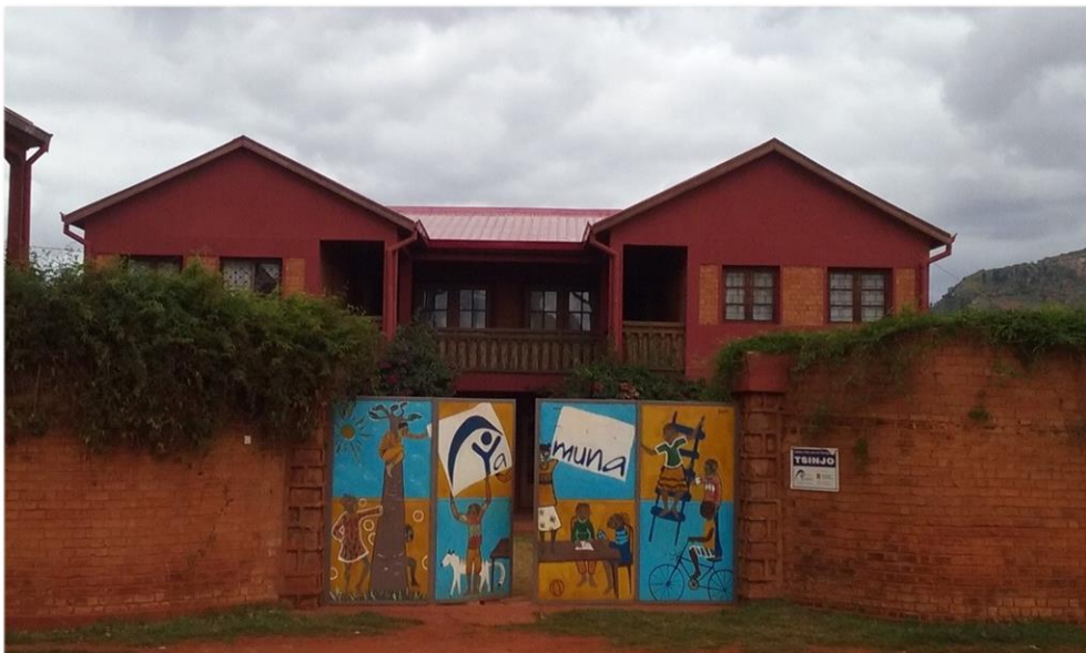
Fachada del edificio Tsinjo, donde se encuentra la Maison d'Hôtes Tsinjo

En el mismo recinto en el que está ubicado el edificio que se dedica a la Maison d'Hôtes, se llama el Centro Tsinjo, y aquí se encuentra la sede de la entidad, el jardín de infancia y un huerto ecológico que mantienen las mujeres del proyecto de mujeres y reinserción económica y social, también están ubicadas las dos familias de acogida.