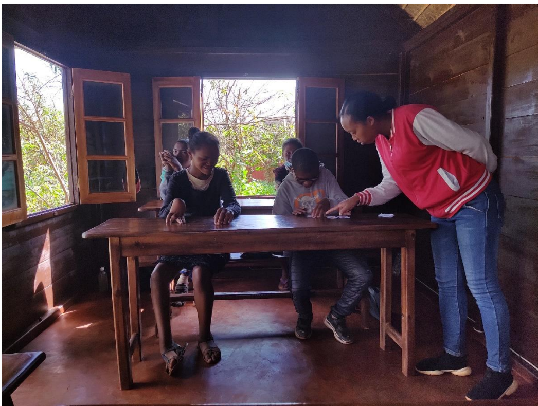
La educadora especializada haciendo clase

YAMUNA también trabaja con sus familias y con otros beneficiarios adultos para ayudarlos a iniciar una actividad económica que represente unos ingresos complementarios o principales para sus familias.