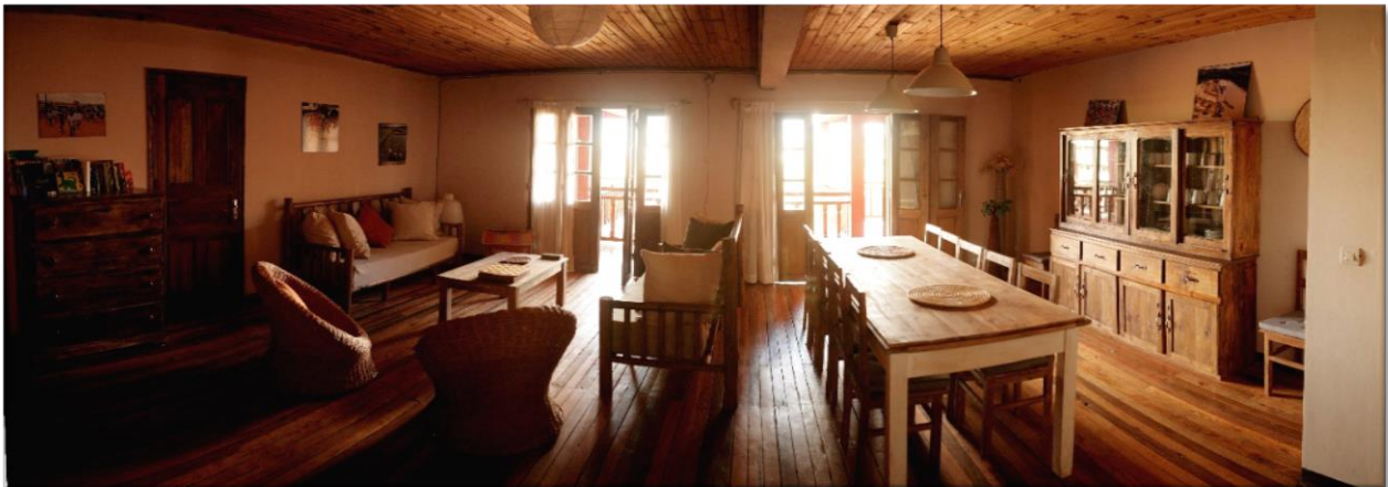
Comedor y sala común de la Maison Tsinjo

Las tres habitaciones comparten cocina, comedor, sala de estar y terraza.