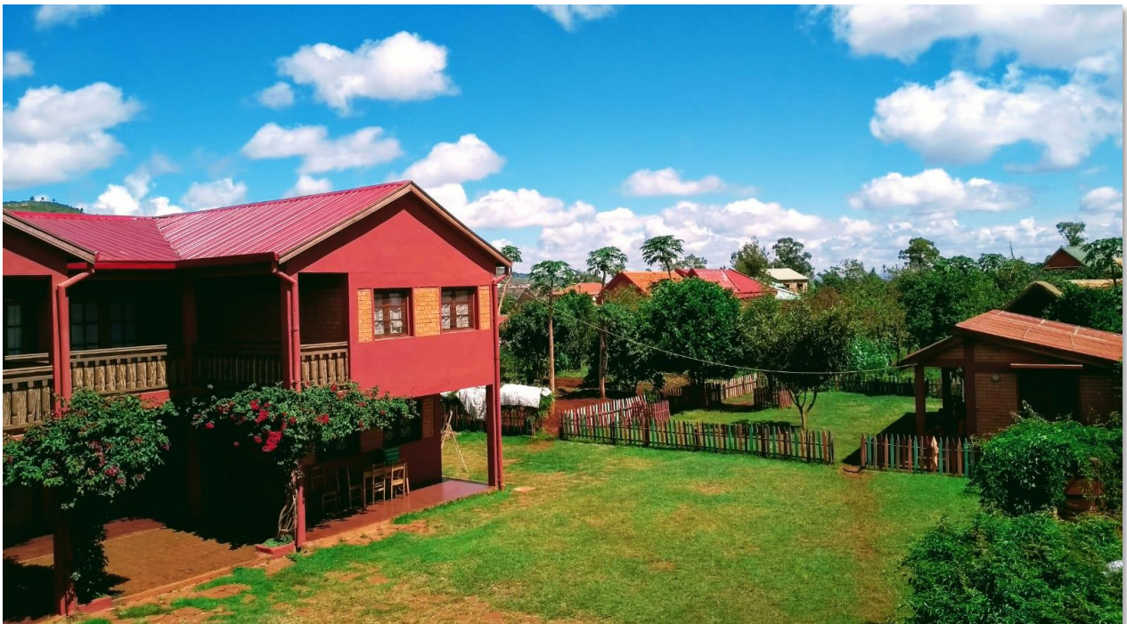
Vista del huerto y de la casa de madera del jardín de infancia desde el edificio lateral.

Dentro del recinto hay un huerto de cultivo ecológico que cuidan y mantienen los agricultores de la cooperativa a los que YAMUNA da apoyo.