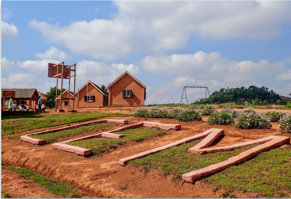
Vistas del CEM, la escuela de YAMUNA

Además de visitar nuestros proyectos acompañados de personal de YAMUNA, el viajero o viajera solidaria tendrá la posibilidad de participar en alguna actividad dentro de nuestros programas, si lo desean, en el CEM o en la Cooperativa de mujeres de YAMUNA, siempre que sea posible.